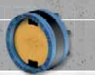
Curaflex Nova® Uno/O (mit Verschluss-Stopfen) > als dauerhafter Blindverschluss

Curaflex Nova® Uno ist die ideale, effiziente Basisanwendung für alle gängigen Rohr- und Kabeldurchmesser.