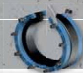
Curaflex Nova® Uno/T (geleimte Version) > bei bestehender Medienleitung

EFFIZIENTE STANDARD-LÖSUNG FÜR GÄNGIGE MEDIENLEITUNGEN